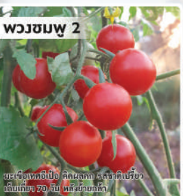
มะเขือเทศ (Tomato)