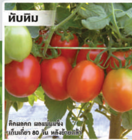
มะเขือเทศผลใหญ่ลูกผสม (Tomato)