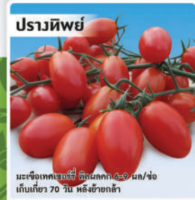
มะเขือเทศ (Tomato)