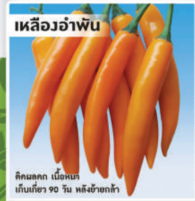
พริกเหลืองลูกผสม (Hot Pepper)