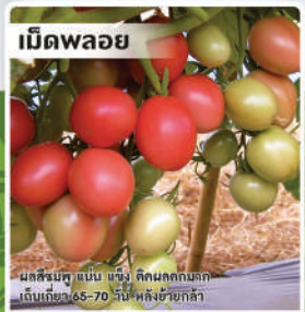
มะเขือเทศสีดาลูกผสม (Tomato)