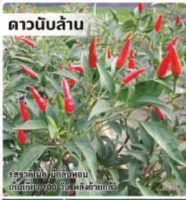
พริกขี้หนูสวน (Hot Pepper)