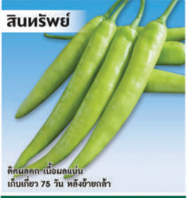
พริกหนุ่มขาวลูกผสม (Hot Pepper)