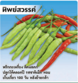
พริก (Hot Pepper)