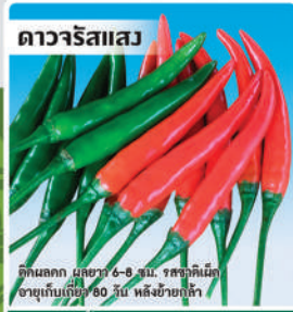
พริกขี้หนูลูกผสม (Hot Pepper)